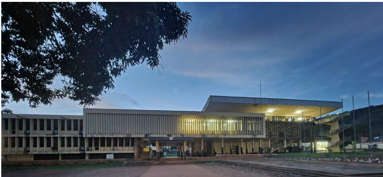
La Cour d'appel de Bangui, où devraient se tenir les sessions criminelles. Bangui, octobre 2021.

En dépit des défis posés par la pandémie et la situation sécuritaire du pays, l'incapacité à organiser une session criminelle au bout de 20 mois témoigne également d'un manque de volonté politique et d'un dysfonctionnement du système de justice pénale.