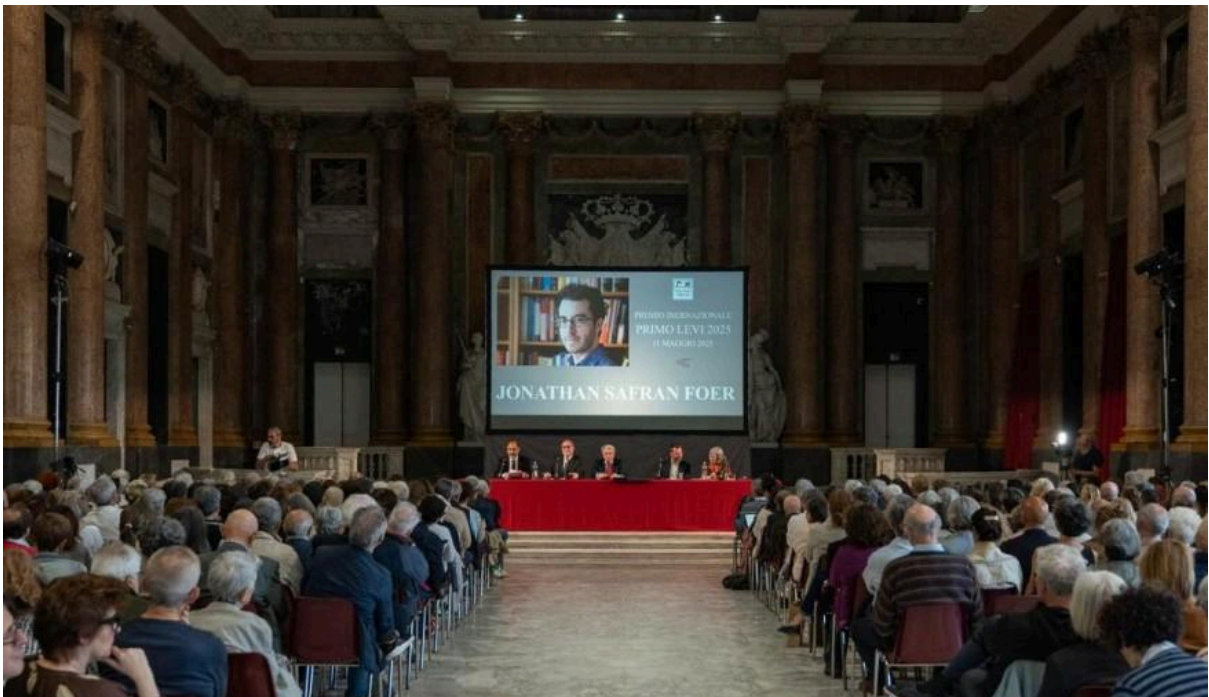
Réception de son prix Primo Levi

Ce soir, je veux donc parler non seulement de Levi, mais de cette tradition plus profonde dans laquelle il s'inscrivait. Une tradition qui affirme : être humain, c'est être troublé.