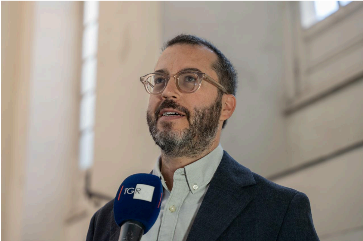
Jonathan Safran Foer, le jour de la réception de son prix Primo Levi