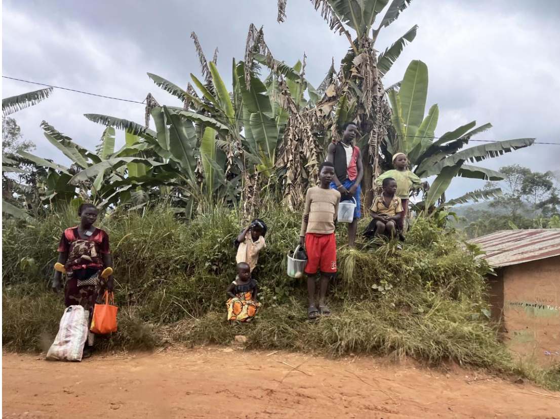
Selon l'ONU, les ADF figurent parmi les principaux acteurs responsables d'atteintes aux droits humains des enfants en RDC, notamment d'enlèvement, de recrutement et d'utilisation d'enfants.

Le Protocole II aux Conventions de Genève fixe à 15 ans l'âge minimum de recrutement ou de participation aux combats pour toutes les parties à un conflit armé 249 . Plus récemment, le Protocole facultatif à la Convention relative aux droits de l'enfant, concernant l'implication d'enfants dans les conflits armés (OPAC), ratifié par la RDC le 11 novembre 2001, interdit le recrutement ou l'utilisation lors des hostilités de personnes de moins de 18 ans, notamment par des groupes armés non étatiques 250 . Le recrutement d'enfants de moins de 15 ans et leur participation active aux hostilités constituent des crimes de guerre 251 .