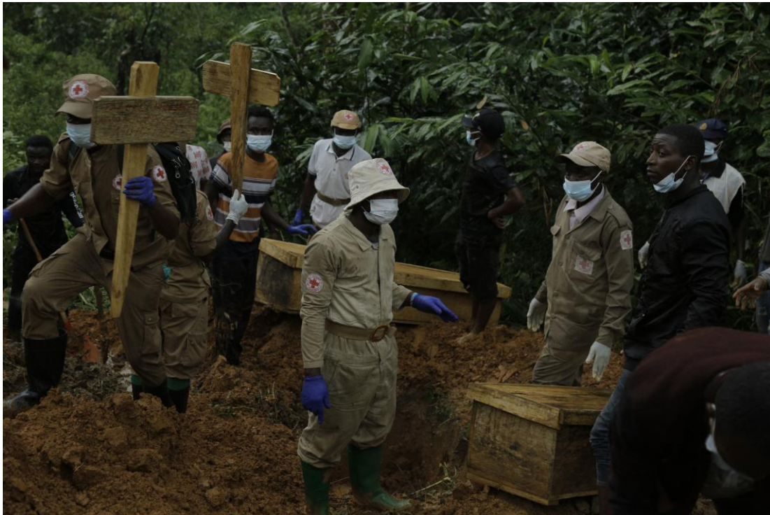
Des bénévoles de la Croix-Rouge réunis autour de cercueils dans lesquels se trouvent des dépouilles de victimes, lors d'une cérémonie d'inhumation dans le village de Ntoyo, le 10 septembre 2025, après l'une des plus terribles attaques des ADF de cette année-là. Les combattant-e-s ont tué plus de 60 personnes lors de cette attaque.

D'autres caractéristiques propres aux actions des ADF illustrent également l'approche méthodique adoptée par le groupe : exactions visant des populations civiles pour les punir de leur proximité avec les autorités, représailles après des opérations militaires, volonté de distraire les forces armées régulières pour les éloigner des principaux camps du groupe, etc. Les pillages de denrées, notamment alimentaires, nécessaires à la survie des membres du groupe, et ses attaques contre des postes militaires pour s'emparer d'armes et de munitions traduisent également une démarche calculée.