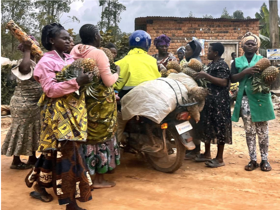
Les ADF ont systématiquement enlevé des femmes et des filles et les ont soumises à des « mariages » forcés, de l'esclavage sexuel et d'autres graves atteintes aux droits humains.

Les entretiens réalisés par Amnesty International montrent que les femmes et filles n'avaient aucune prise sur les décisions liées à leur corps, notamment en matière de procréation, et qu'elles étaient soumises à une servitude domestique et à des périodes prolongées de violences sexuelles et physiques. Le mariage forcé et la grossesse forcée, ainsi qu'une myriade d'autres violations y étant associées, constituent des crimes de guerre et des crimes contre l'humanité.