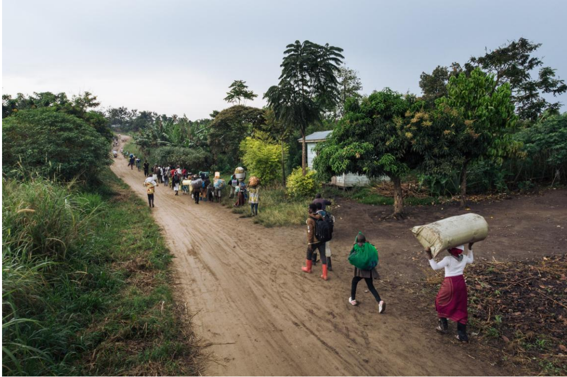
La campagne incessante de violences des ADF a exacerbé la crise humanitaire dans l'est de la RDC, causant notamment de nouveaux déplacements de civil-e-s.

réalisés par Amnesty International et des informations très largement disponibles 22 . Les revendications du groupe précisent bien qu'il entend s'en prendre spécifiquement aux chrétien-ne-s et ses dirigeants soulignent qu'il est permis de les tuer 23 . On remarquera cependant que le groupe utilise également dans ses communiqués des qualificatifs tels que « non-croyants », terme générique incluant les musulman-e-s qui ne partagent pas sa vision de la religion et son mode de vie (l'usage au quotidien de ce terme étant confirmé par des personnes ayant été enlevées par les ADF 24 ).