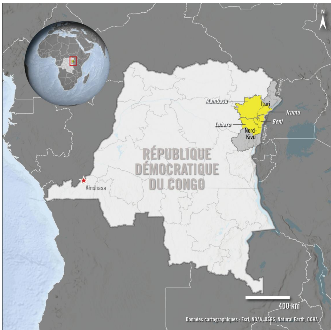
La carte ci-dessus montre les quatre territoires (en jaune) dans les provinces du Nord-Kivu et de l'Ituri dans lesquels Amnesty International a recensé des exactions des Forces démocratiques alliées (Allied Democratic Forces - ADF)