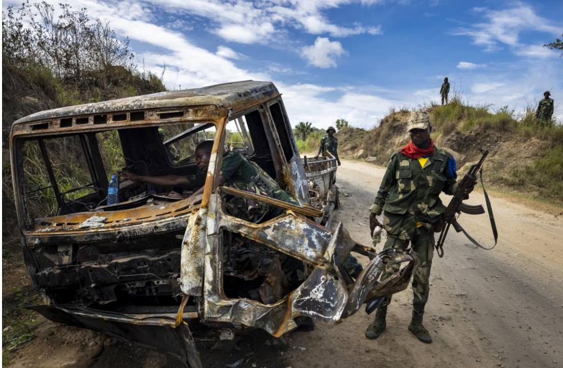
Des soldats des FARDC inspectent le lieu d'une embuscade des ADF contre deux véhicules le 7 avril 2021, à Mbau. Des combattant-e-s des ADF enlèvent régulièrement des civil-e-s dans le cadre d'attaques de grande ampleur, d'embuscades sur des routes et d'attaques contre des exploitations agricoles.

Le groupe installe depuis longtemps des camps au plus profond de la forêt. L'emplacement et la taille des camps changent au fil des ans, surtout à la suite d'opérations militaires. À la publication de ce rapport, il était supposé que le camp principal de Madina, où vit Musa Baluku, le dirigeant des ADF, se trouvait dans l'est du territoire de Mambasa, dans la province de l'Ituri ; plusieurs autres campements se situeraient aussi dans cette province 163 . L'un des regroupements les plus meurtriers des ADF agit depuis un camp situé dans le nord-ouest du territoire de Lubero, dans le Nord-Kivu 164 .