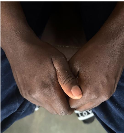
Amnesty International s'est entretenue avec une femme qui a été enlevée en 2025 et conduite vers un camp des ADF, où elle a été chargée de s'occuper des femmes qui accouchaient et de leurs nouveau-nés.

Comme évoqué précédemment, des combattant-e-s forcent systématiquement des personnes enlevées à transporter des marchandises quand elles sont capturées dans leurs villages et jusqu'à ce qu'elles atteignent les camps du groupe. Pour une partie de celles et ceux restés dans les camps pendant des mois, voire des années, c'est devenu leur « travail ». Une personne ayant été enlevée puis maintenue en captivité pendant six mois avant de s'échapper a fait le récit suivant :