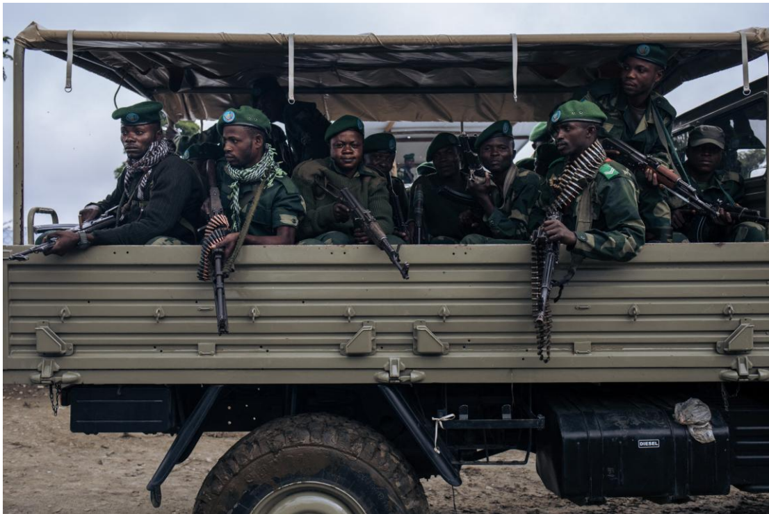
Des soldats mènent un exercice de déploiement rapide le 24 mai 2021 en périphérie de Mutwanga, où les ADF ont mené plusieurs attaques.

La femme de 31 ans originaire d'Otmaber qui a été blessée par balle dans l'attaque de juillet 2025 a déclaré que sa maison avait été épargnée cette nuit-là, mais qu'elle et sa famille avaient néanmoins perdu beaucoup d'argent. « Mon mari gagne sa vie en chargeant des téléphones portables », a-t-elle expliqué. « Ils ont pris tous les téléphones [qui se trouvaient dans la maison]. Il y avait des portables, des batteries internes et externes [...] Ils ont pris un million de francs congolais [450 dollars des États-Unis] que nous venions de recevoir d'un groupe d'épargne collective 138 . »