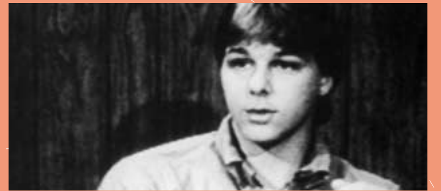
ÉTATS-UNIS. SEAN SELLERS A ÉTÉ EXÉCUTÉ POUR UN CRIME COMMIS À L'ÂGE DE 16 ANS, APRÈS UN PROCÈS COMPORTANT DE GRAVES IRRÉGULARITÉS ET ALORS QUE LES PSYCHIATRES AVAIENT CERTIFIÉ SON RETARD MENTAL. LES USA DÉTIENNENT LE RECORD DU MONDE DE CONDAMNATIONS À MORT DE MINEURS AU MOMENT DES FAITS.

CONTRE LA PEINE DE MORT AMNESTY INTERNATIONAL EST CONTRE LA PEINE MORT. EN TOUTES CIRCONSTANCES.