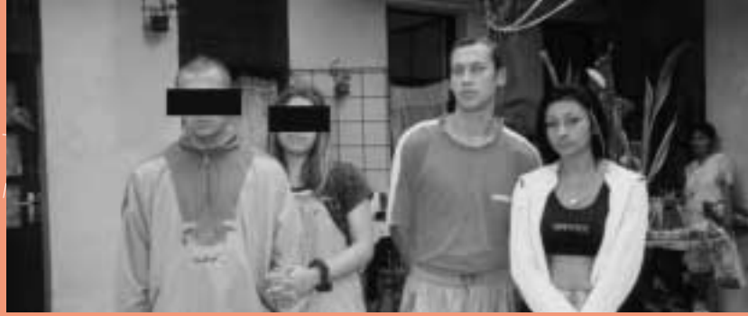
HONGRIE. QUATRE ENFANTS TSIGANES, DONT UN N'AVAIT QUE 13 ANS, ONT ÉTÉ ARRÊTÉS PENDANT UNE RAFFLE VIOLENTE DE LA POLICE À BUDAPEST EN 1999. TROIS GARÇONS ONT ÉTÉ BATTUS ET MENACÉS DE MORT. TROIS FILLES ONT ÉTÉ VICTIMES DE DIFFAMATIONS RACISTES ET SEXISTES.

EMPRISONNÉES POUR LEURS CONVICTIONS, LEURS CROYANCES, LEURS ACTIVITÉS POLITIQUES NON VIOLENTES, LEUR ORIGINE ETHNIQUE OU LEUR ORIENTATION SEXUELLE.