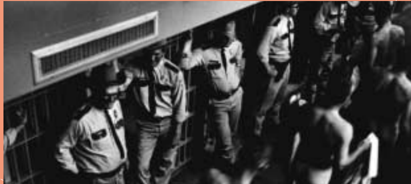
USA. LES PRISONNIERS D'ORIGINE NOIRE SONT RÉGULIÈREMENT VICTIMES DE MAUVAIS TRAITEMENTS.

AMNESTY INTERNATIONAL S'OPPOSE EN TOUTES CIRCONSTANCES À LA TORTURE ET À TOUT AUTRE TRAITEMENT CRUEL, INHUMAIN OU DÉGRADANT.