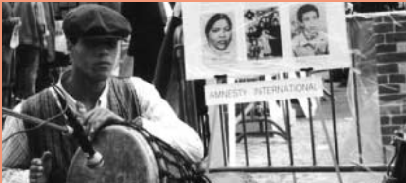
LES ANTENNES-ÉCOLES SONT DES GROUPES DE JEUNES QUI S'IMPLIQUENT DANS LEUR ÉCOLE POUR MIEUX FAIRE CONNAÎTRE LES DROITS HUMAINS ET LES CAMPAGNES D'AMNESTY.

S'INFORMER SUR CE QUI SE PASSE DANS TON PAYS MAIS AUSSI DE L'AUTRE CÔTÉ DE LA PLANÈTE, C'EST DÉJÀ AGIR POUR UN MONDE MEILLEUR. PLUS LES GENS SERONT CONSCIENTS DE LEURS DROITS ET DES SITUATIONS OÙ CES DROITS SONT VIOLÉS, PLUS ILS SERONT CAPABLES DE RÉCLAMER LEUR RESPECT. L'INFORMATION EST LA PREMIÈRE ARME CONTRE LES VIOLATIONS DES DROITS HUMAINS, ICI ET PARTOUT DANS LE MONDE.