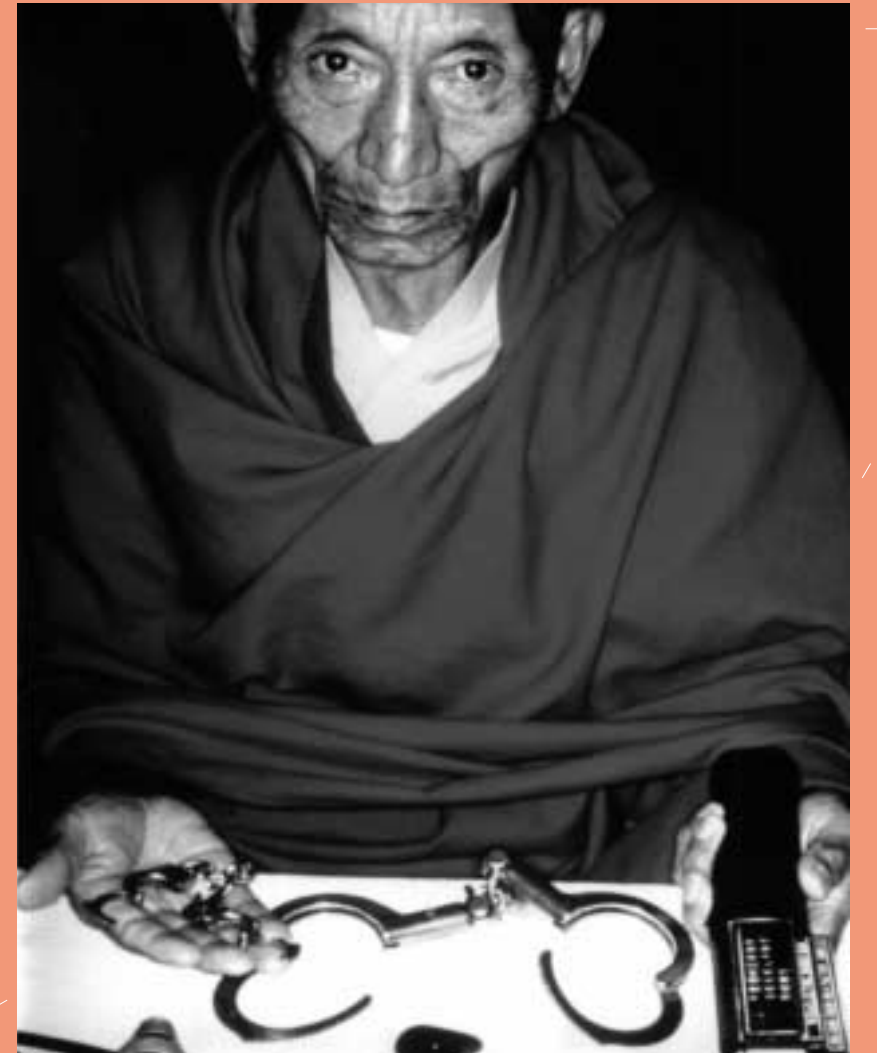
PALDEN GYATSO MONTRER LES INSTRUMENTS AVEC LESQUELS IL A ÉTÉ TORTURÉ PAR LES AUTORITÉS CHINOISES.

AMNESTY INTERNATIONAL S'OPPOSE AUX TRANSFERTS D'ARMES VERS DES ÉTATS QUI LES UTILISENT POUR DÉTENIR DES PRISONNIERS D'OPINION, TORTURER ET EXÉCUTER DES GENS.