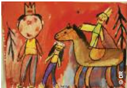
Ci-dessus : Cartes d'images utilisées pour diagnostiquer un handicap mental ; fait partie du test d'intelligence de Wechsler III (WISC III). Le test ne tient pas compte des différences linguistiques et culturelles des Roms. À gauche : Peinture d'un enfant rom étudiant à l'école élémentaire Matice Slovenskej, à Prešov, avril 2010.