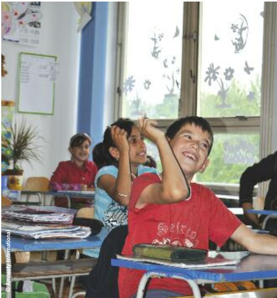
Des élèves roms dans une classe mélangée de l'école élémentaire classique à Pavlovce nad Uhom, Slovaquie, mai 2010.

nombre d'élèves roms (ce qui est désigné en Slovaquie par l'expression « fuite des blancs »), la ségrégation apparaît comme une solution à mettre en œuvre. De plus, les écoles peuvent souvent être influencées par des mesures qui incitent à accroître le nombre d'élèves considérés comme « atteints d'un retard mental », car le financement par élève des élèves arriérés mentaux est deux fois supérieur à celui des élèves sans besoins spéciaux.