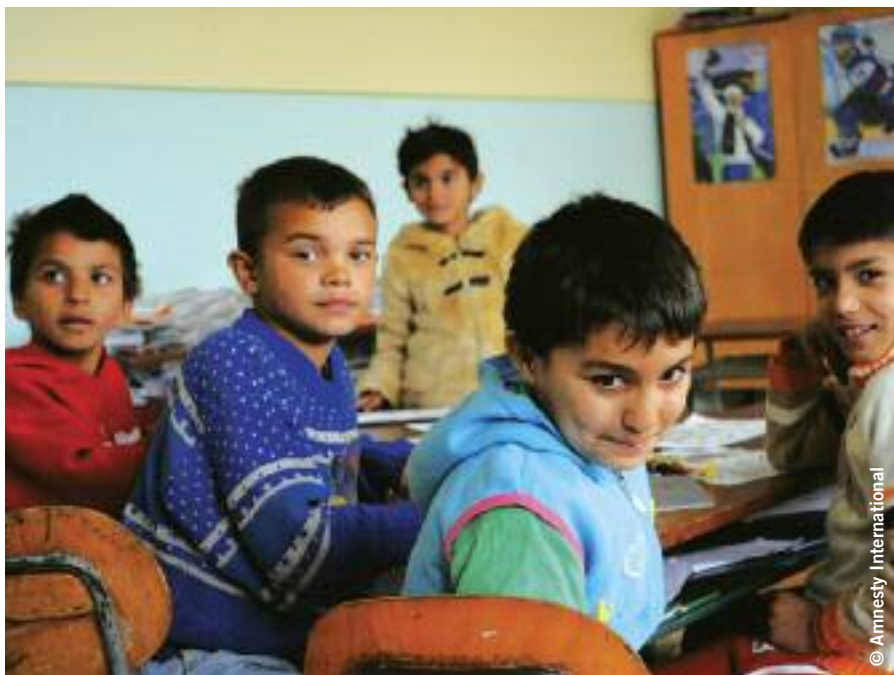
Photo de couverture : Élèves roms faisant des activités de troisième année dans la classe spéciale pour élèves présentant des « handicaps mentaux légers » à l'école élémentaire de Krivany, Slovaquie, avril 2010.

L'idée selon laquelle il est possible d'allier « séparation » et « égalité » a été discréditée. La Slovaquie ne peut pas continuer à nier le droit des enfants roms à la dignité et à l'égalité de traitement. Les choix du gouvernement auront une incidence sur les vies de milliers d'enfants roms. Les Roms risquent l'enfermement dans un cycle de pauvreté et de marginalisation pendant plusieurs décennies. À l'inverse, les choix du gouvernement peuvent leur permettre de profiter de leur droit à une éducation sans discrimination dans des écoles classiques intégrées, les préparant ainsi à participer et à contribuer à part entière à la vie de la société slovaque et européenne.