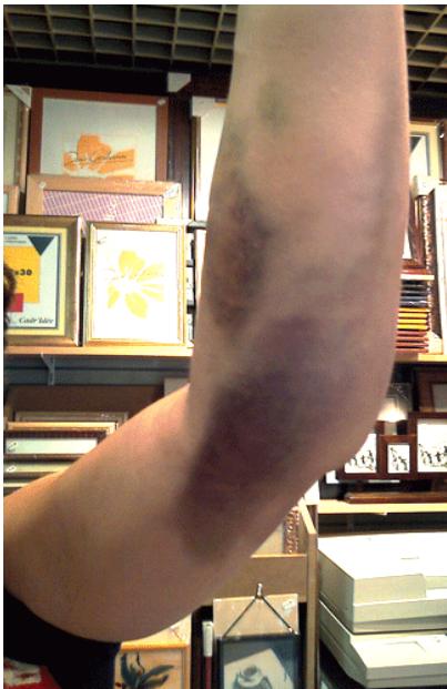
Blessures subies par Évelyne.

Évelyne dit s'être mise à pleurer et avoir demandé au policier pourquoi il se conduisait d'une manière aussi