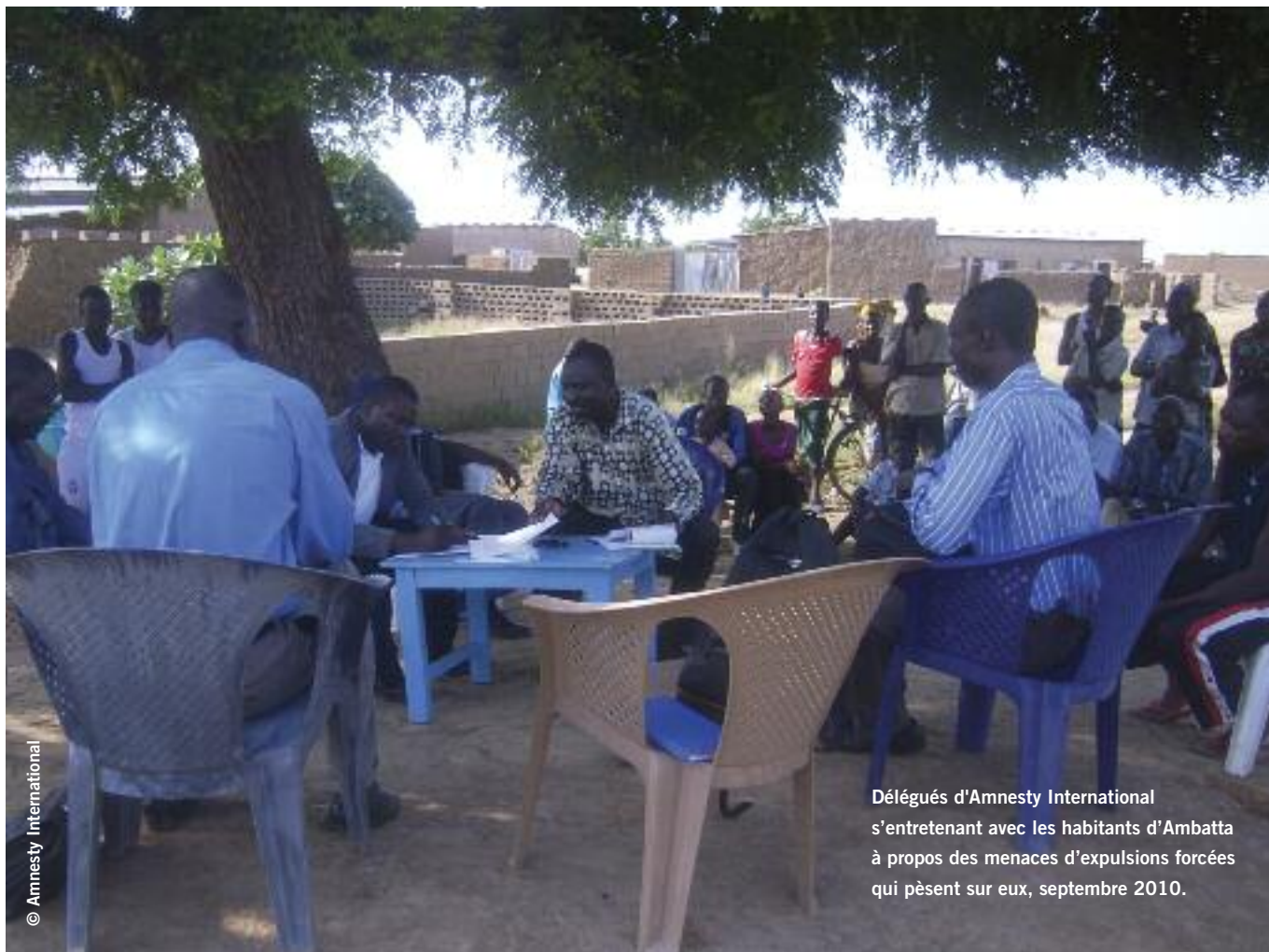
Délégués d'Amnesty International s'entretenant avec les habitants d'Ambatta à propos des menaces d'expulsions forcées qui pèsent sur eux, septembre 2010.

intervenir qu'en dernier recours, une fois que toutes les autres solutions possibles ont été envisagées, et à condition que toutes les garanties nécessaires pour une procédure satisfaisante soient en place, notamment :