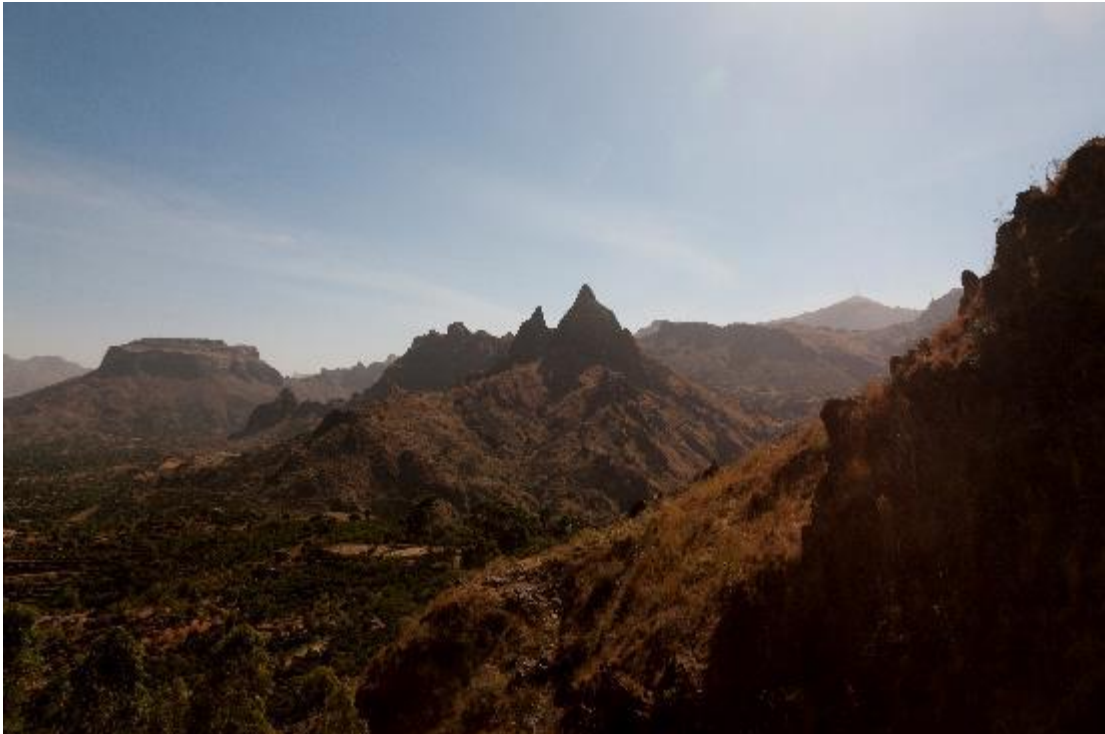
Les montagnes du Djebel Marra près de Dursa, dans le centre du Darfour (Soudan), mars 2015.