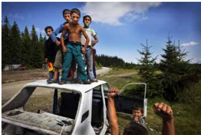
Des enfants Roms sur une carcasse de voiture, août 2010, Roumanie

Un portrait de groupe où chacun joue son rôle