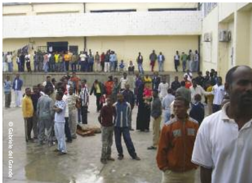
Réfugiés et migrants réunis dans la cour du centre de détention de Misratah (Libye), novembre 2008.

Les recherches menées par Amnesty International et d'autres groupes de défense des droits humains ont fait apparaître les violations généralisées commises contre les migrants clandestins, les réfugiés et les demandeurs d'asile en Libye sous le régime du colonel Kadhafi ainsi que pendant et après le conflit qui l'a chassé du pouvoir 4 . Parmi les violations identifiées figurent la détention illimitée dans des conditions déplorables, les coups et d'autres mauvais traitements s'apparentant parfois à des actes de torture. Par ailleurs, les réfugiés et les demandeurs d'asile courent un risque réel d'être refoulés (renvoyés dans un pays où ils sont exposés à des persécutions et à d'autres