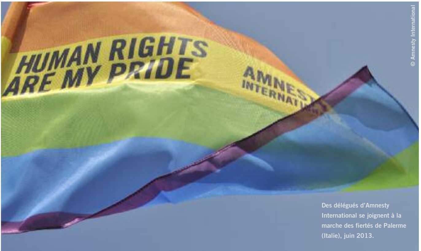
Des délégués d'Amnesty International se joignent à la marche des fiertés de Palerme (Italie), juin 2013.