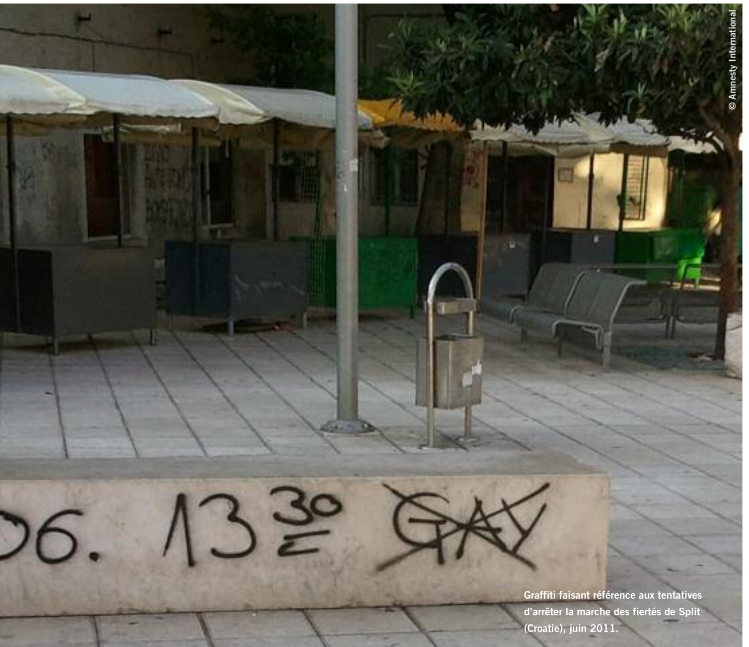
Graffiti faisant référence aux tentatives d'arrêter la marche des fiertés de Split (Croatie), juin 2011.