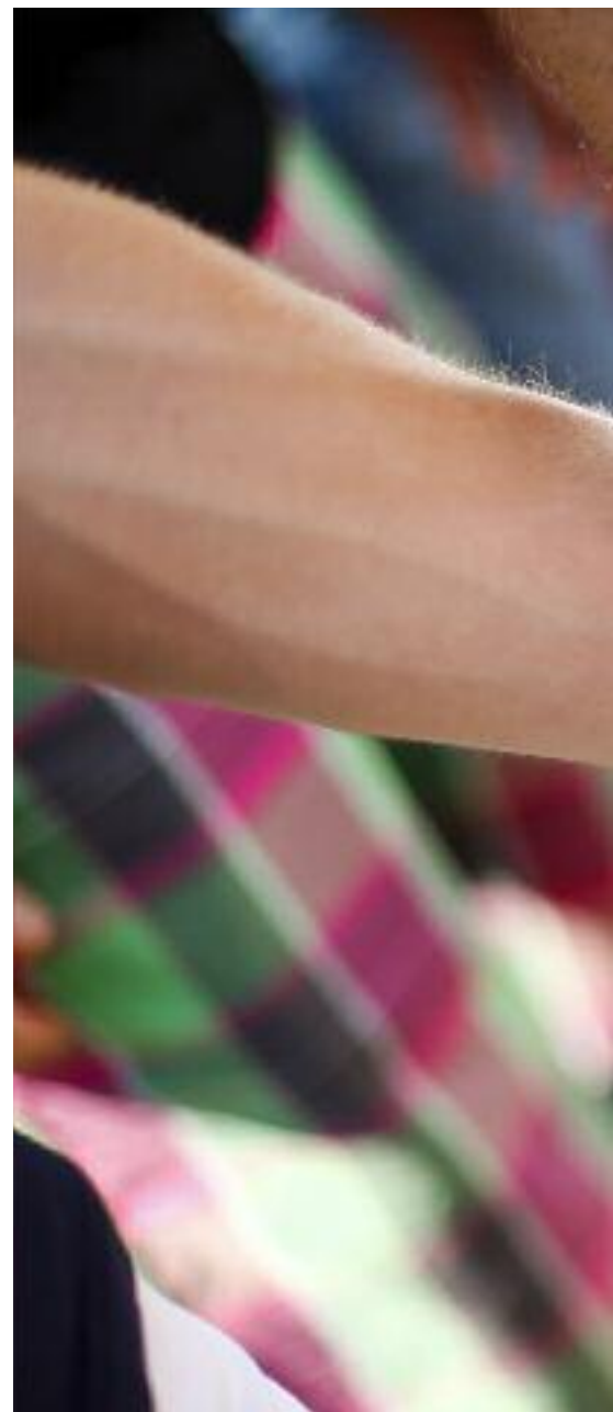
Un couple gay se tient la main pendant la marche annuelle des fiertés à Rome (Italie), juin 2013.

En décembre 2011, alors qu'elle sortait d'une boîte de nuit, un homme s'est approché d'elle et lui a fait des avances sexuelles. Comme elle a refusé, d'autres hommes sont arrivés et l'ont agressée. « Ils m'ont rouée de coups de poing et