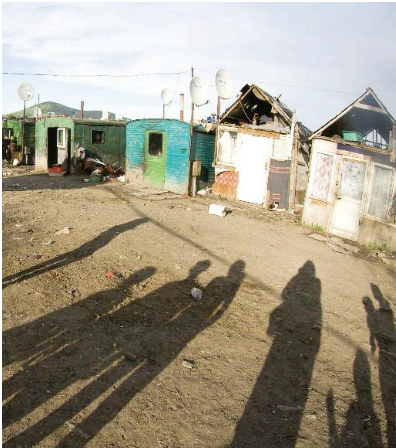
Les préfabriqués et les baraques sont raccordés au réseau électrique. Ils sont néanmoins impropres à l'habitation car ils n'offrent pas un espace suffisant ni ne protègent de l'humidité, de la chaleur, de la pluie et du vent.